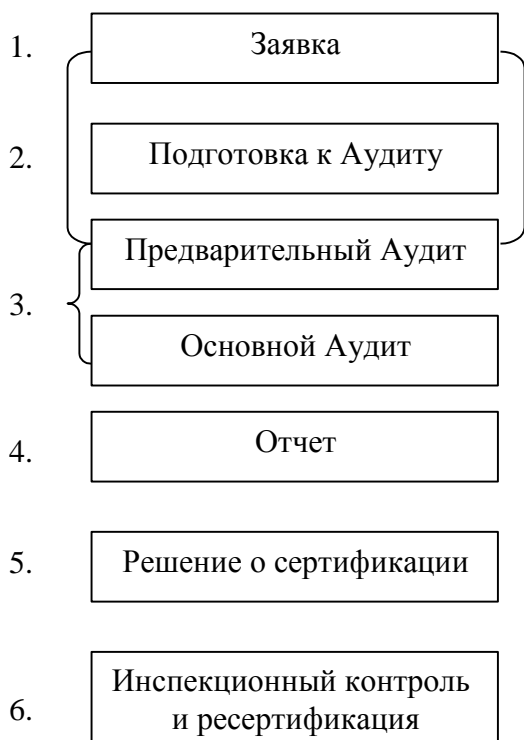
Схема 4.1 Процесс сертификации

1,2) процессы, связанные с субъектом лесной сертификации;